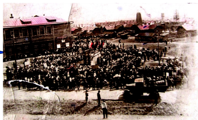
1930-е годы. Здание Средней школы №10 ст.Агрыз Казанской железной дороги. Перед зданием школы был пустырь, где проходили первомайские и ноябрьские демонстрации.